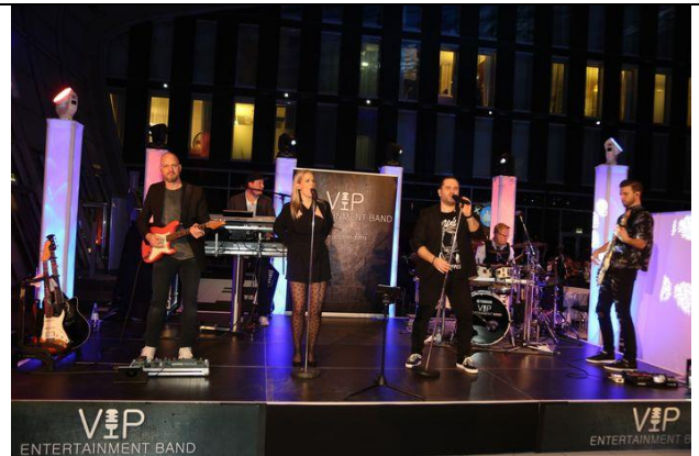
VIP Entertainment Band