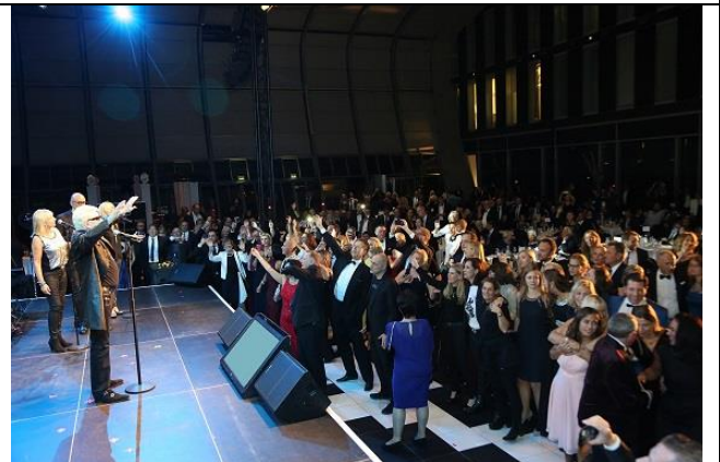
Heino mit Band

Spendenkonto Westerwald Bank eG BLZ 573 918 00 Kto.Nr. 5550