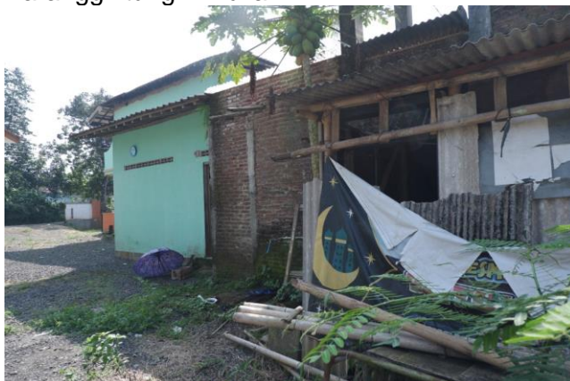
Karanggintang – Mulia