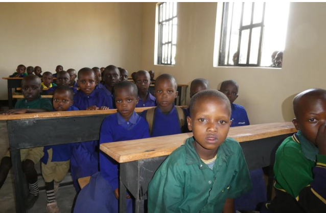
Lekimelok III + IV – noch im Bau