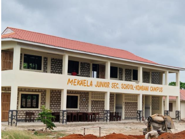
Kombani (vorher keine Schule vorhanden)