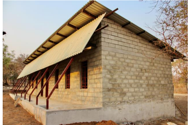
Zalewa II (noch im Bau)