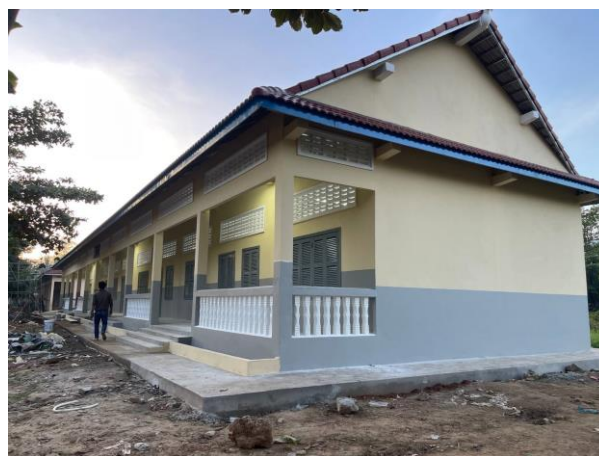
Kdol Ta Hen