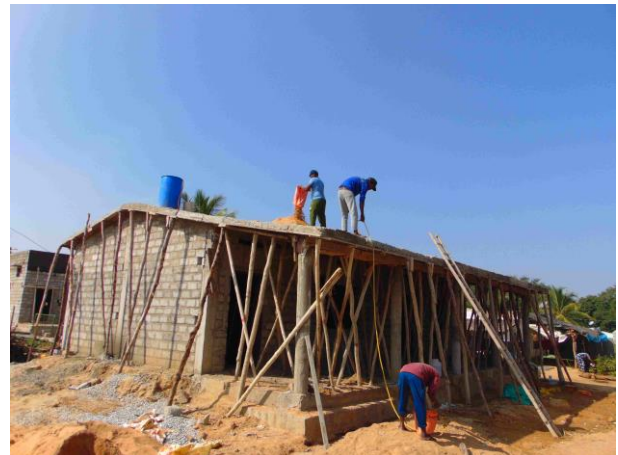
Pedda Thumbalam (noch im Bau)