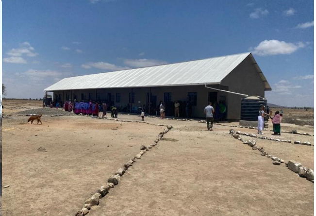
Makuyuni Juu – noch im Bau (Toilettenblock)