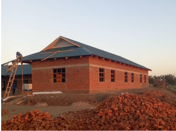
Mzungu/Tadala (vorher keine Schule vorhanden)