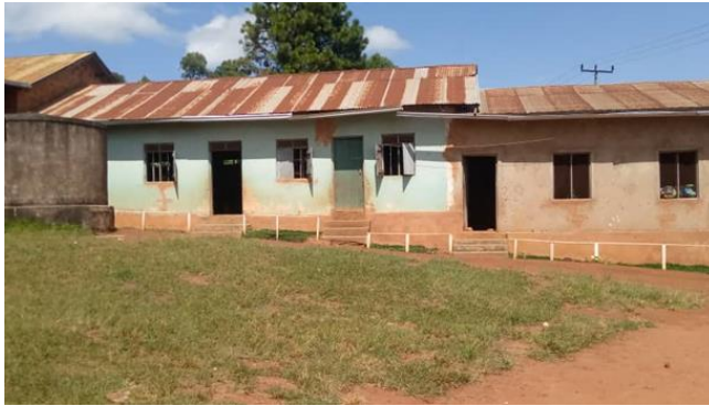
Bembereza II – Upendo e.V.