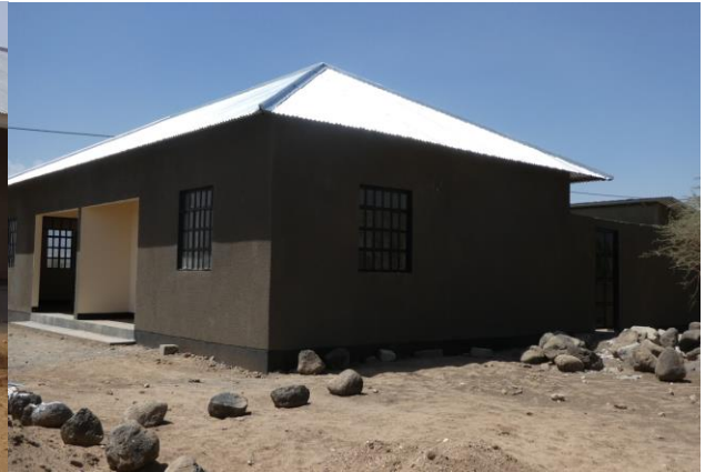
Emboreet Lenaitunyo PS II