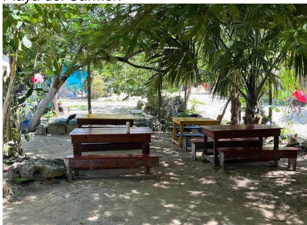
Playa del Carmen