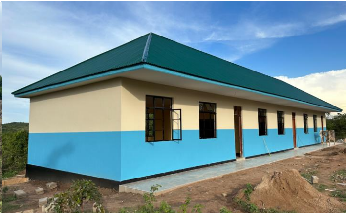
Lambo - PROBONO Schulpartnerschaften für Eine Welt e.V.