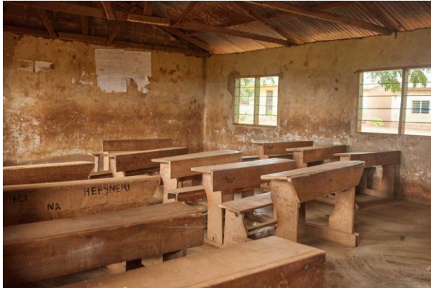
Darajani - AKO Aktionskreis Ostafrika e.V.