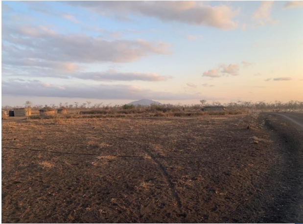
Loosirimi I und II (4 Bilder)