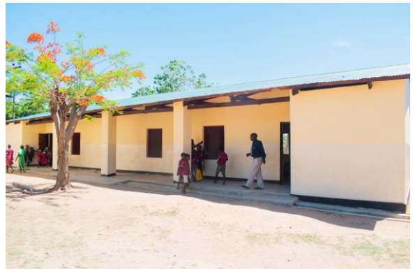
Chiutila - Baobab - PS Mlambe (vorher keine Schule vorhanden)