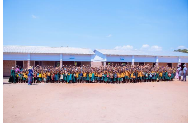
Cholokoto II - Nafulu (B2)