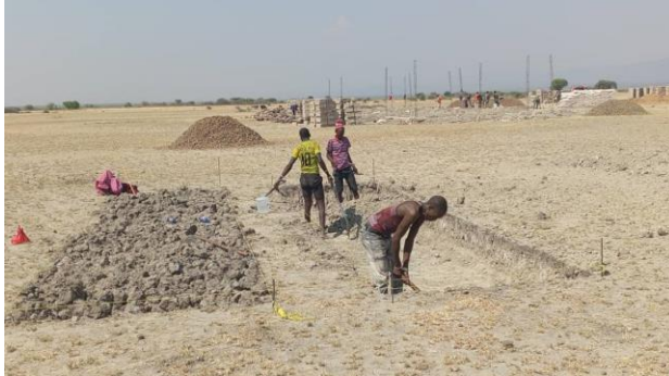
Eshkesh I bis III (4 Bilder)