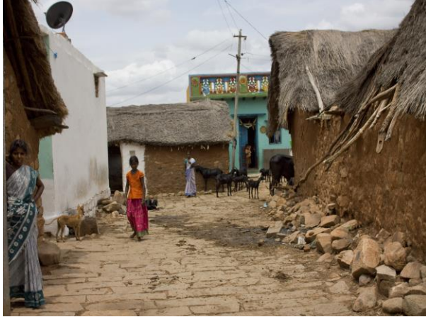
Gantaihoddi (noch im Bau)