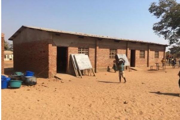
Cholokoto I - Nafulu (B1)