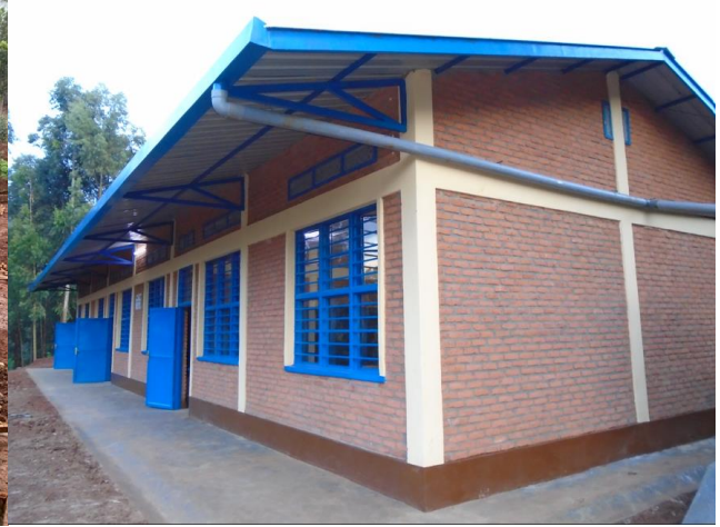
Gicumbi SBMDC School – noch im Bau