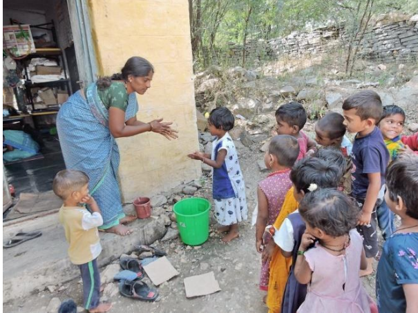
Nagaladinne (noch im Bau)