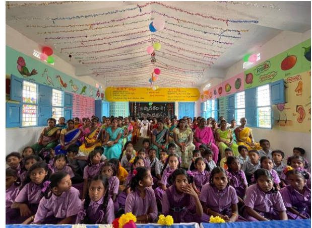
Marrimakulapalli (noch im Bau)