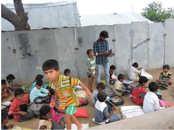
Kamavaram (noch im Bau)