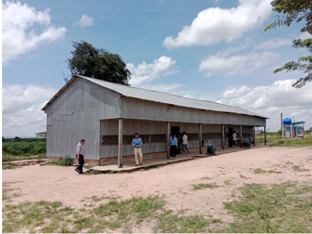
O Trach Krom