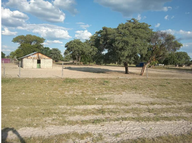
Mbeyo – Kuseka