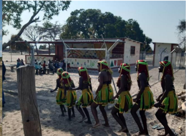
Okahandja - Five Rand Grundschule