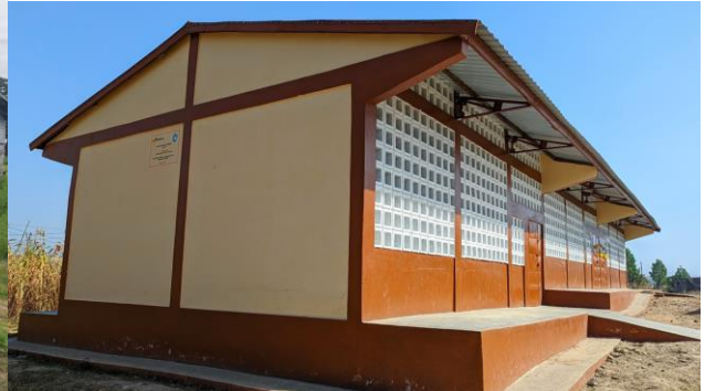
Kankampoukyo – noch im Bau