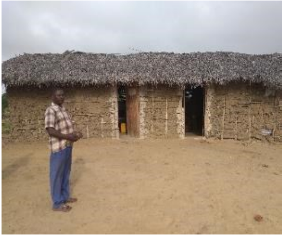
Katsangani – noch im Bau