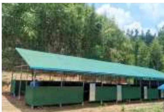
Seh Theh Learning Center