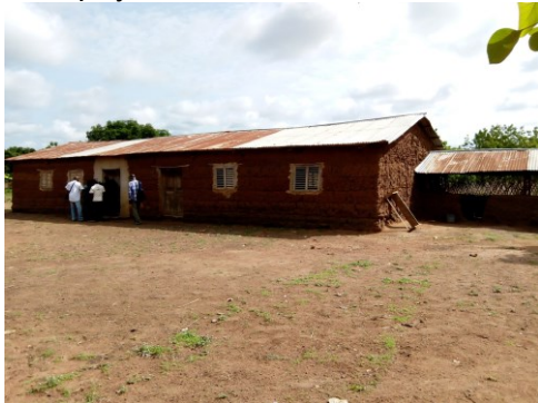
Atinkpayé – noch im Bau