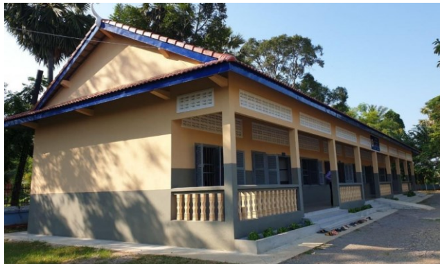
Cham Roeun Reath Cham