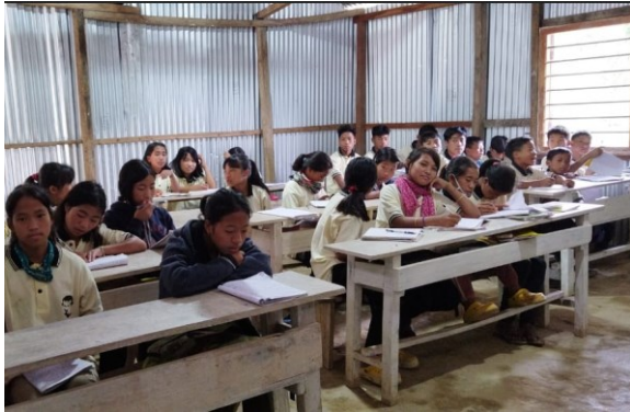
Khasa – noch im Bau