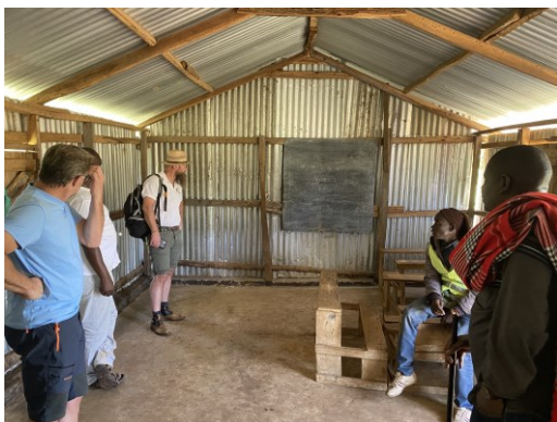
Great Education Center – noch im Bau