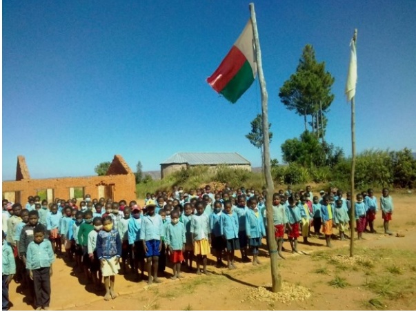
Ijely – Faliarivo