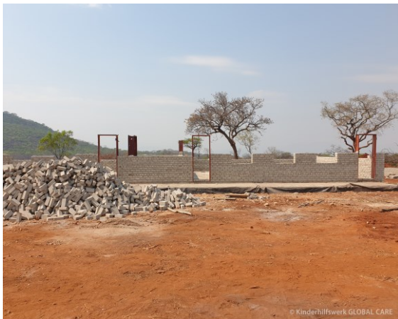
West End Farm