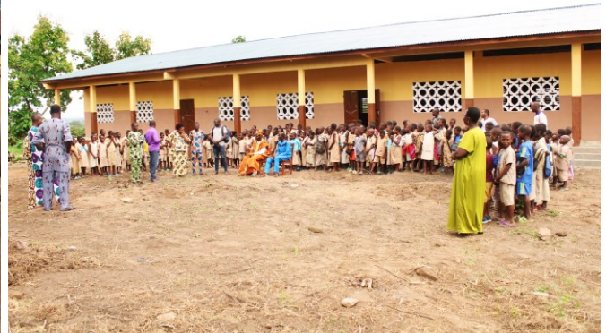
N`Gbeho – noch im Bau