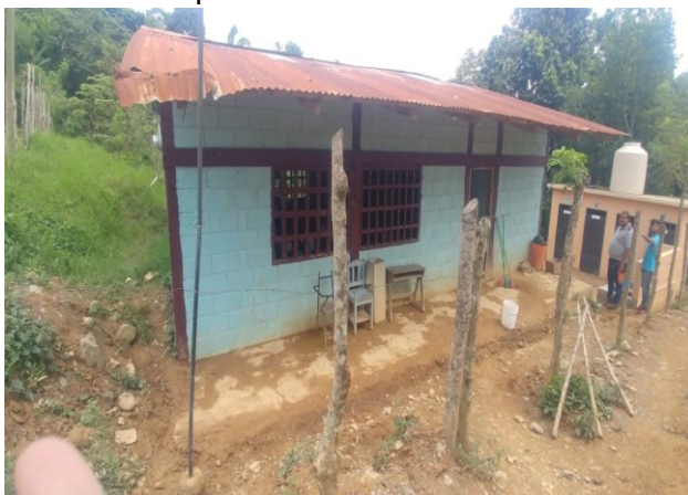
El Triunfo Copan Ruinas