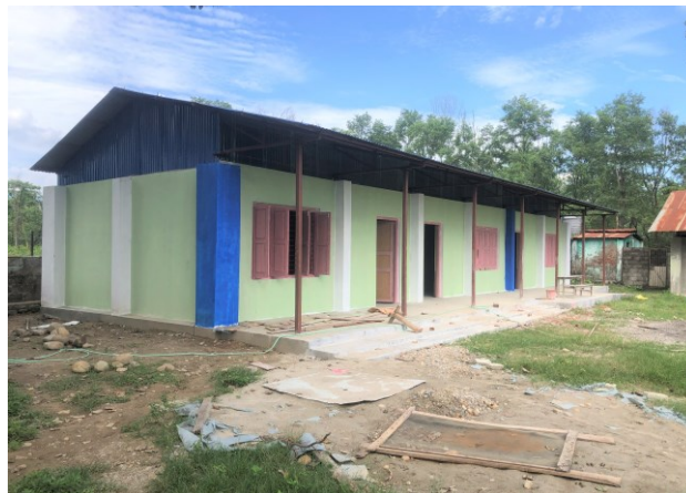
Rupakot II – noch im Bau