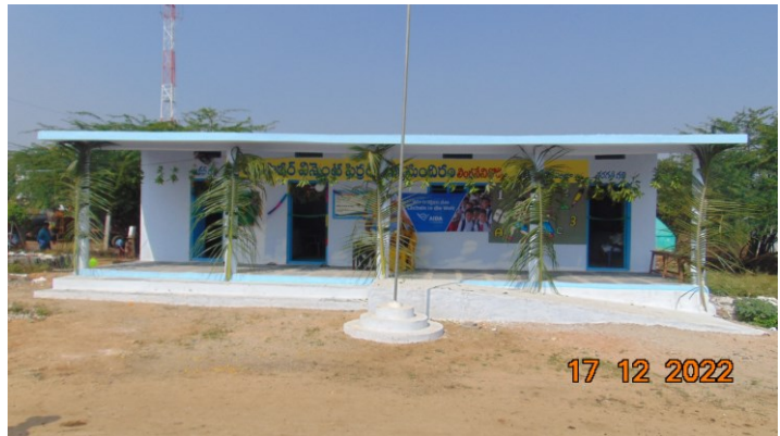
Mallikarjunapalli – noch im Bau